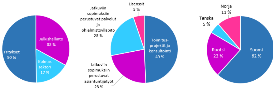
Liikevaihdon jakauma 1.1 - 30.9.2019

Innofactorin liiketoiminta keskittyi Suomeen, Ruotsiin, Tanskaan sekä Norjaan. 1.1.–30.9.2019 liikevaihdosta noin 62 prosenttia tuli Suomesta, noin 22 prosenttia Ruotsista, noin 11 prosenttia Norjasta ja noin 5 prosenttia Tanskasta. Liikevaihto kasvoi Suomessa ja Norjassa, mutta laski Ruotsissa ja Tanskassa.